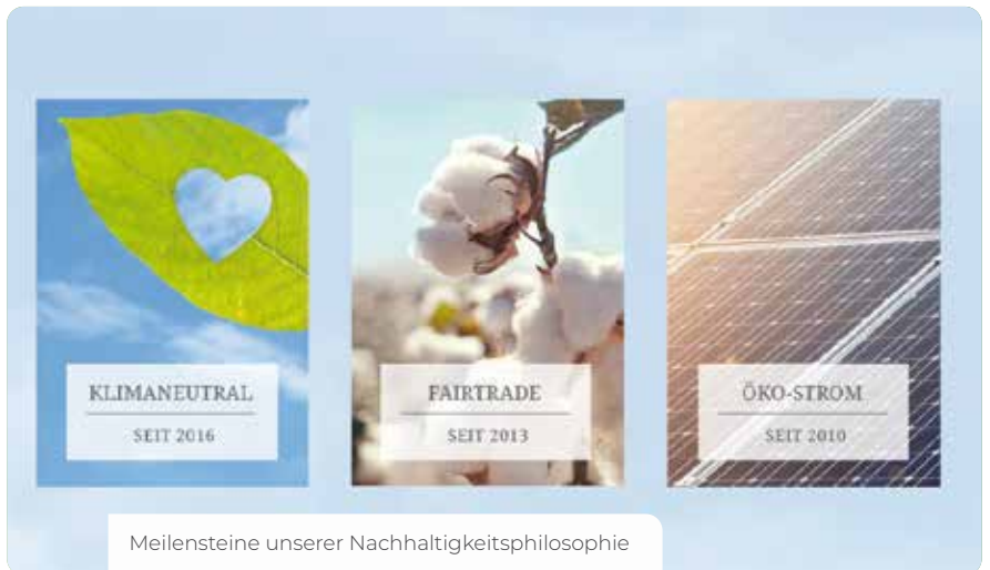
Meilensteine unserer Nachhaltigkeitsphilosophie

Modernisierung der Heizungsanlage bzgl. Energieeffizienz, Vermeidung von Wärmeverlust in Leitungssystemen.